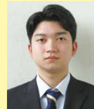
ちば そら 千葉 天